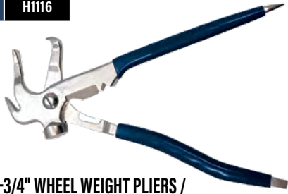
9-3/4" WHEEL WEIGHT PLIERS / PINCES POUR MASSES D'ÉQUILIBRAGE DE ROUE DE 9-3/4 PO