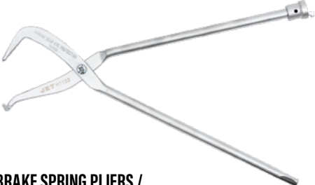
BRAKE SPRING PLIERS / PINCES À RESSORT DE FREIN