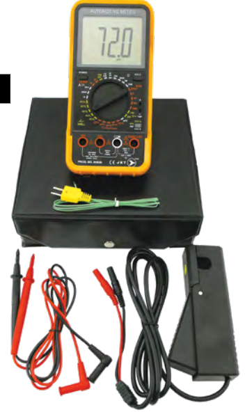
FULL-RANGE DIGITAL AUTOMOTIVE MULTIMETER KIT / TROSSE DE MULTIMÈTRE NUMÉRIQUE AUTOMOBILE À PLAGE COMPLÈTE