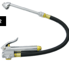
AIR LINE INFLATOR WITH TIRE GAUGE / GONFLEUR DE PNEUS AVEC MANOMÈTRE