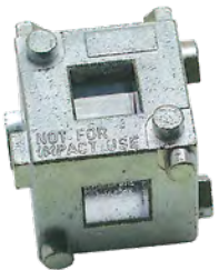
REAR DISC BRAKE CALIPER TOOL / OUTIL POUR ÉTRIER DE FREIN À DISQUE ARRIÈRE