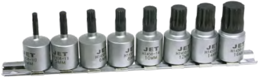
8-PC 3/8" DR TRIPLE SQUARE BIT SET / JEU DE 8 EMBOUTS À TRIPLE CARRÉS À PRISE DE 3/8 PO SIZE RANGE: 4 - 16 MM