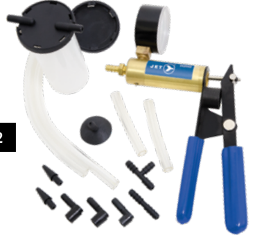
DELUXE VACUUM PUMP WITH BLEEDER KIT / POMPE À VIDE DE LUXE AVEC KIT DE PURGE